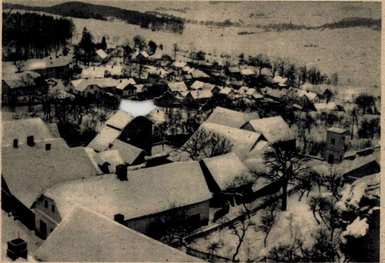
Lipnice v zimě

Dopis, který měl dokumentární formu, zaslal jsem v opise na vědomí Syndikátu českých spisovatelů. Od